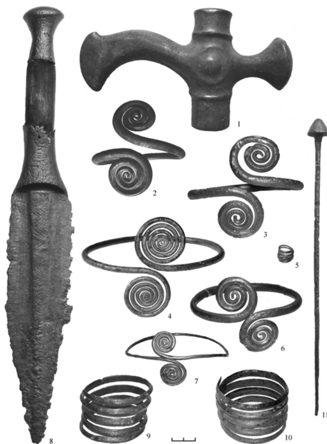
Рис. 4. Металеві вироби з курганного могильника східнотшинецької культури в с. Івання Дубнівського р-ну Рівненської обл., за І. Маркусом.