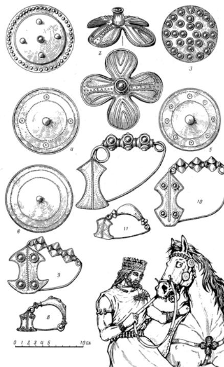
Рис. 2. Золоті бляшки і фібули з Михалківських скарбів (1–6 – бляшки, 7–11 – аркоподібні фібули, 12 – реконструкція, за М. Бандрівським і Л. Крушельницькою).

За демографічними підрахунками, на теренах України в той час могло проживати 1,5–1,7 млн. осіб. Порівняно значна щільність населення та згадані вище процеси впливали на прискорений соціальний розвиток спільнот: складалася стратифікація об'єднань, виділялася еліта, військові вожді. Всі ці зрушення розпочалися ще в період енеоліту 10 , однак найчіткіше помітні в III–II тисячоліттях до н. е., що простежується в поховальних